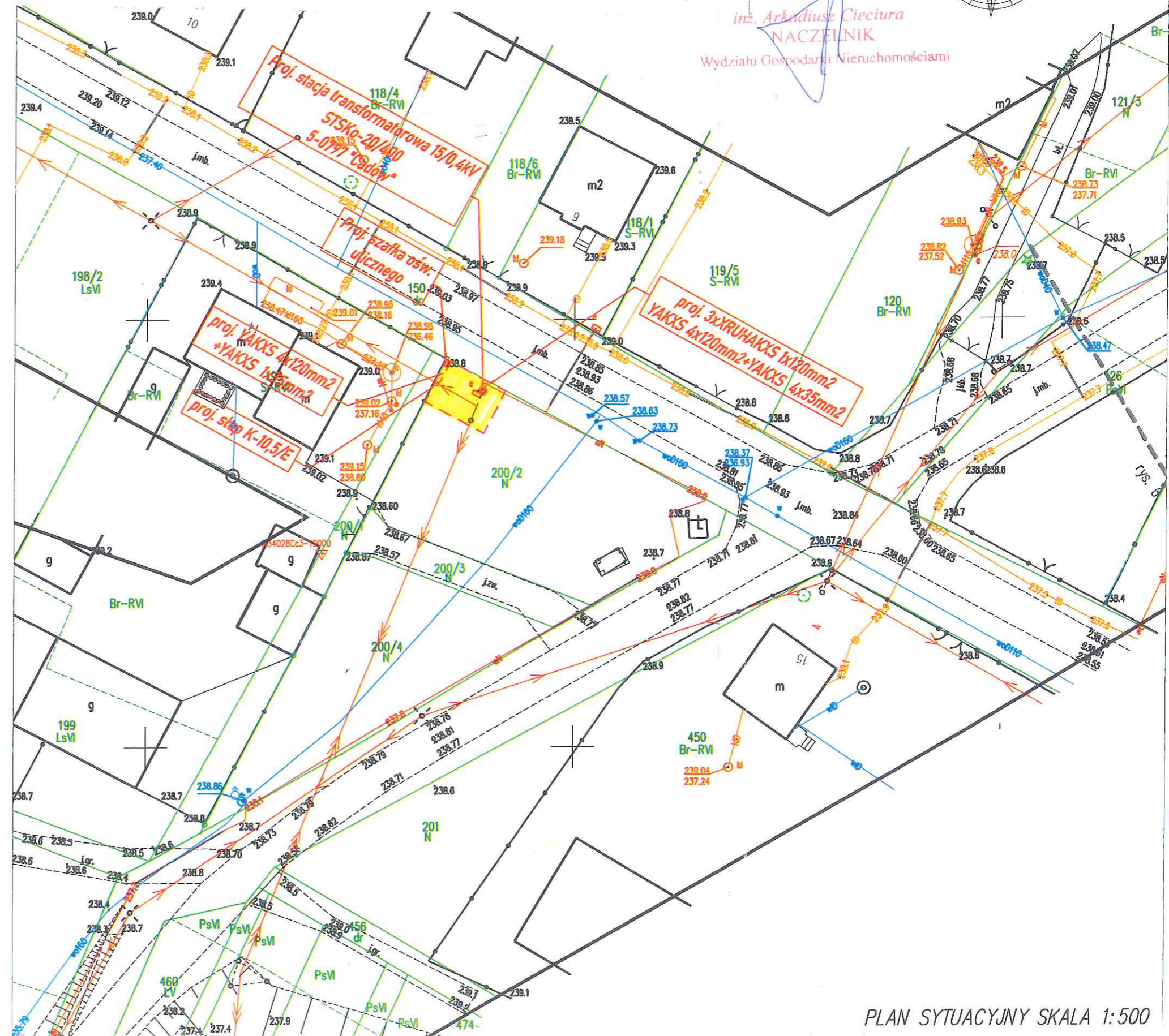
PLAN SYTUACYJNY SKALA 1:500

z up. STAROSTY inż. Arkadiusz Cieciora NACZELNIK Wydziału Gospodarki Nieruchomościami