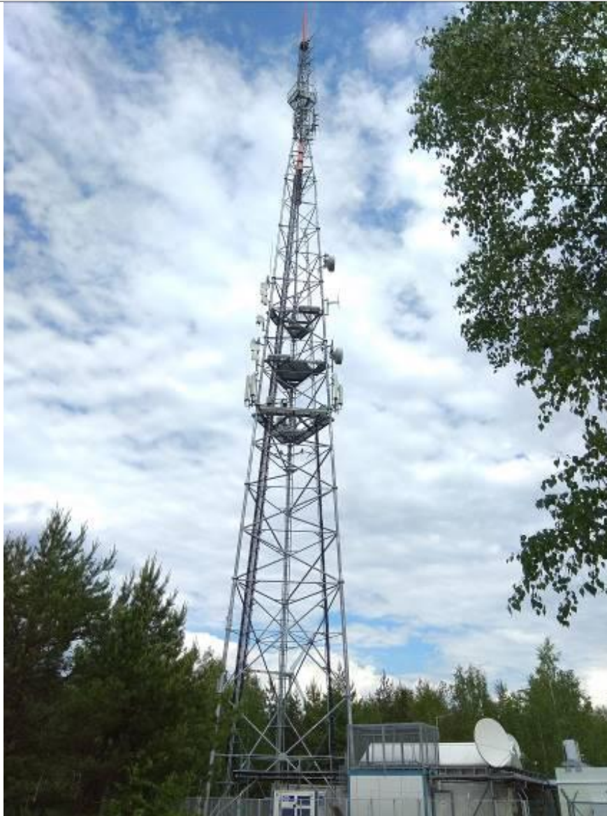
Fot. 1. TSR Kamieńsk – widok obiektu