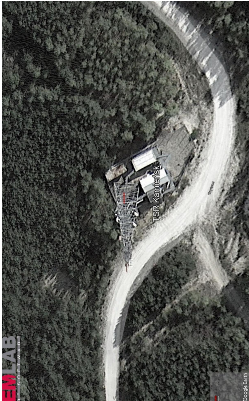
Rys. 2. Rzut poziomy rozkładu pola elektromagnetycznego anteny nowo projektowanej linii radiowej w otoczeniu TSR Kamieński przewidzianej do zainstalowania na wysokości 28 m nad poziomem terenu.