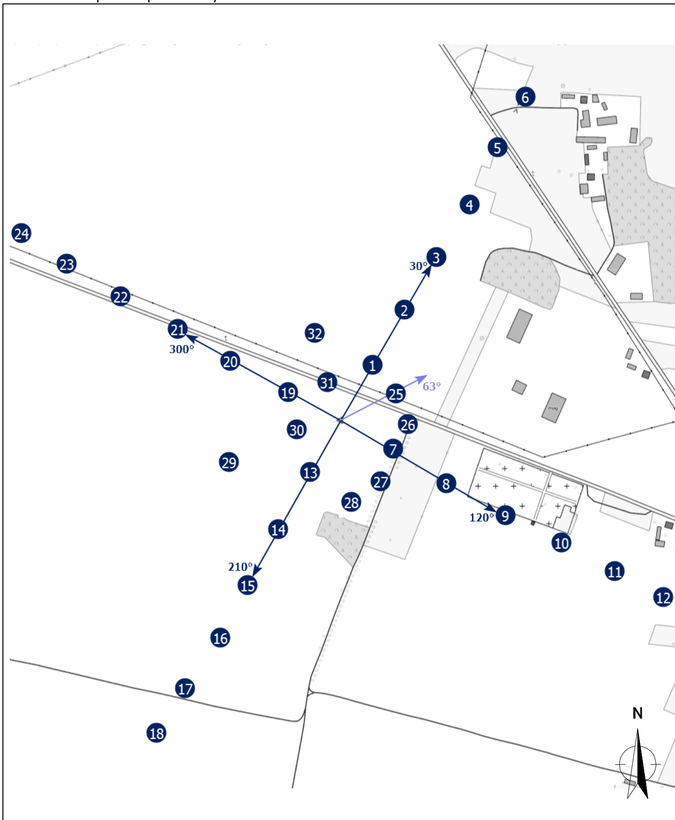
Załącznik 2. Widok pionów pomiarowych