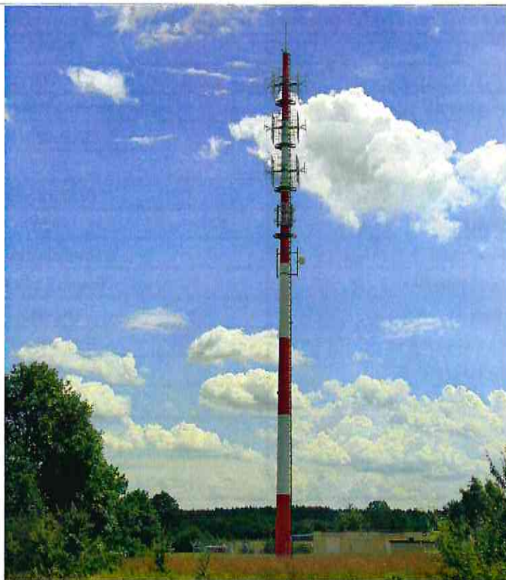
Fot. 1. OM OR Jabłonna Przedbórz - dz. nr 2499 – widok wieży z anteną linii radiowej