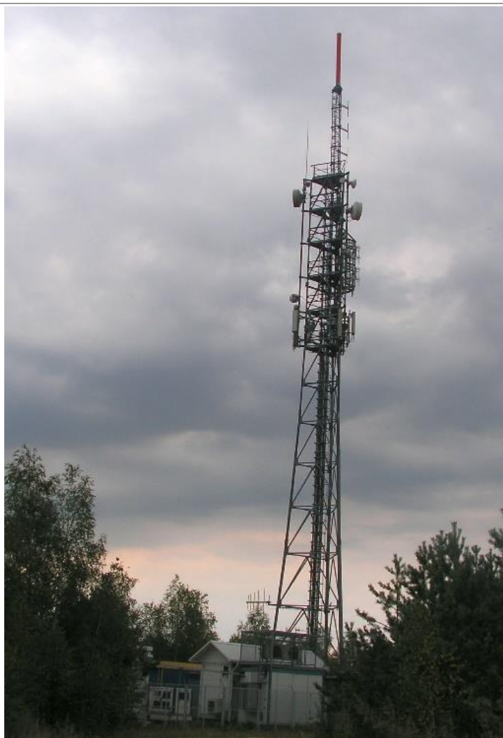
Fot. 1. RTCN Kamięnsk / Zwałowisko – widok obiektu