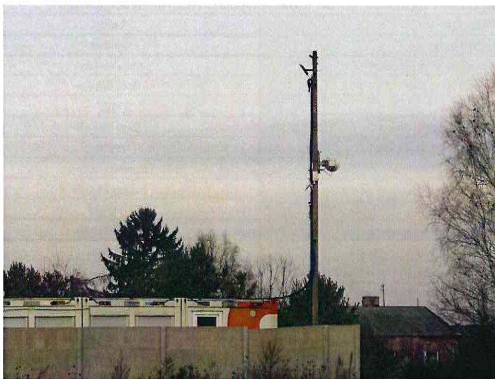
Fot. 1. OM Dobroszyce / Strabag Malutkie – widok anteny Emitel